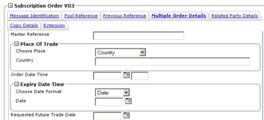
Illustration 2: Exemple de personnalisation des vues écrans

L'utilisateur peut donc travailler de la même façon avec un message FIN, SIC, XML ou FIX ou bien avec des messages propriétaires et son savoir-faire n'est pas perturbé. L'affichage des messages et leur mise en page peut être adapté de manière interactive. Les champs peuvent être déplacés en dehors du message, être réorganisés et mis en tableaux. Les listes déroulantes peuvent être adaptées au contexte. Les clients apprécient ces fonctionnalités très puissantes qui les aident à construire des solutions business légères pour la gestion/manipulation des messages.